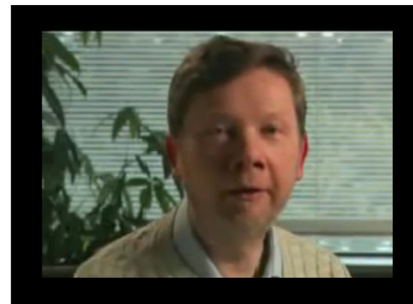
Transformación de la Consciencia

Eckhart es un reconocido conferenciante y enseña y viaja extensamente por todo el mundo. Muchas de sus conversaciones, y retiros serán publicados en CD y DVD. La mayor parte de las enseñanzas se dan en Inglés, pero a veces también Eckhart habla en alemán y español.