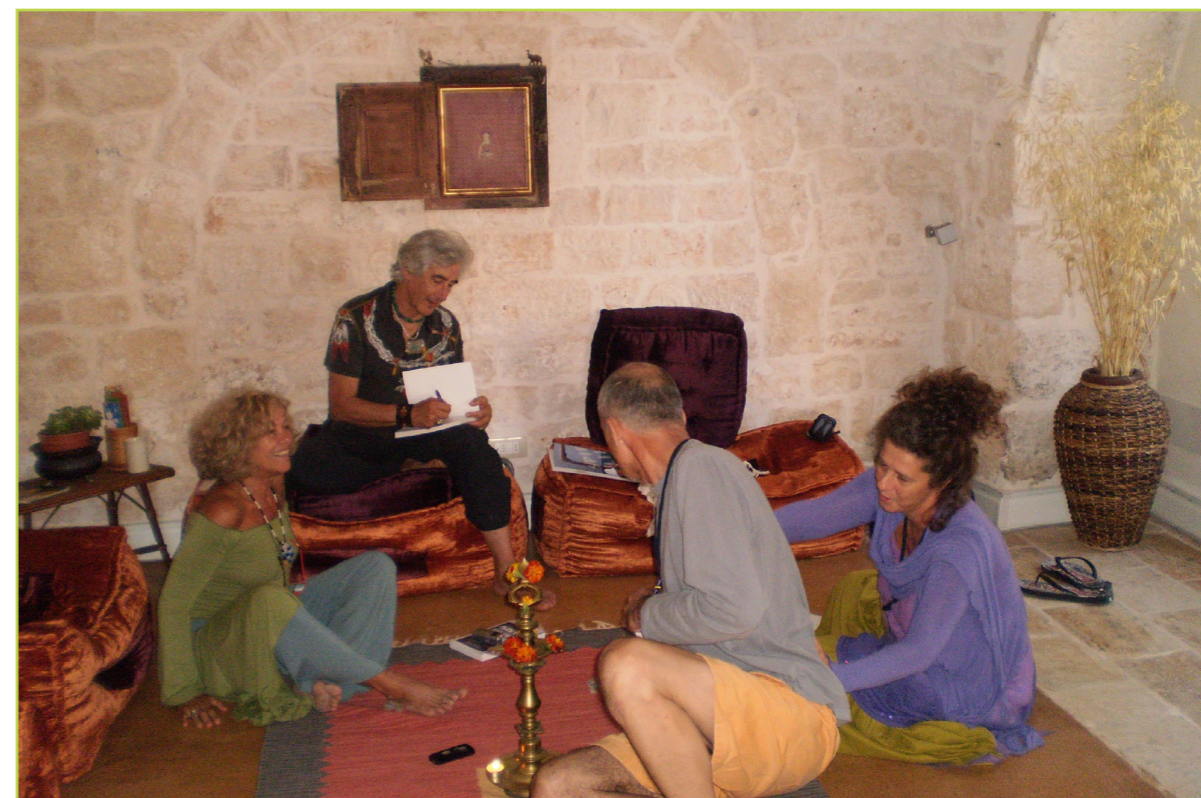
Entrevista a José Argüelles

“PASAR DEL CALENDARIO GREGORIANO AL SINCRONARIO DE LAS 13 LUNAS ES UN ACTO CONSCIENTE, UNA ELECCIÓN CONSCIENTE. LAS PERSONAS REQUIEREN CONCIENCIA PARA SEGUIR EL SINCRONARIO DE LAS 13 LUNAS DE 28 DÍAS. HAY UNA ELEVACIÓN DE CONCIENCIA, QUE ES UNO DE LOS PUNTOS CLAVE.”